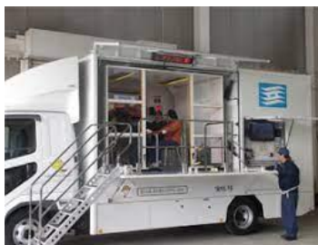
起震車による地震体験