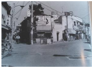
昭和62年撮影 さんかく食堂