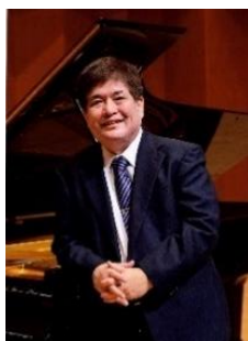
同志社女子大学音楽学科教授