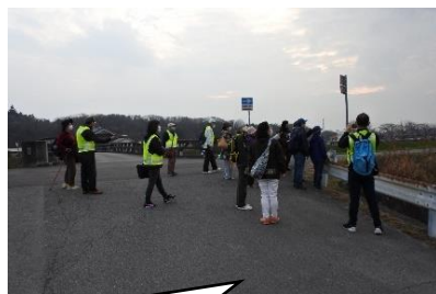
16時 鉄屋橋にて解散。 お疲れ様でした。