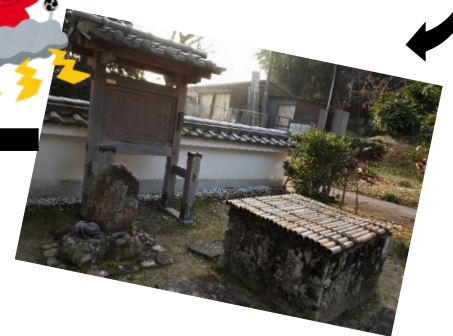
くわばらくわばら、ここは桑原欣勝寺