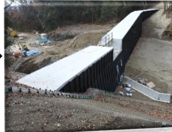
13時40分 完成直前の砂防ダム